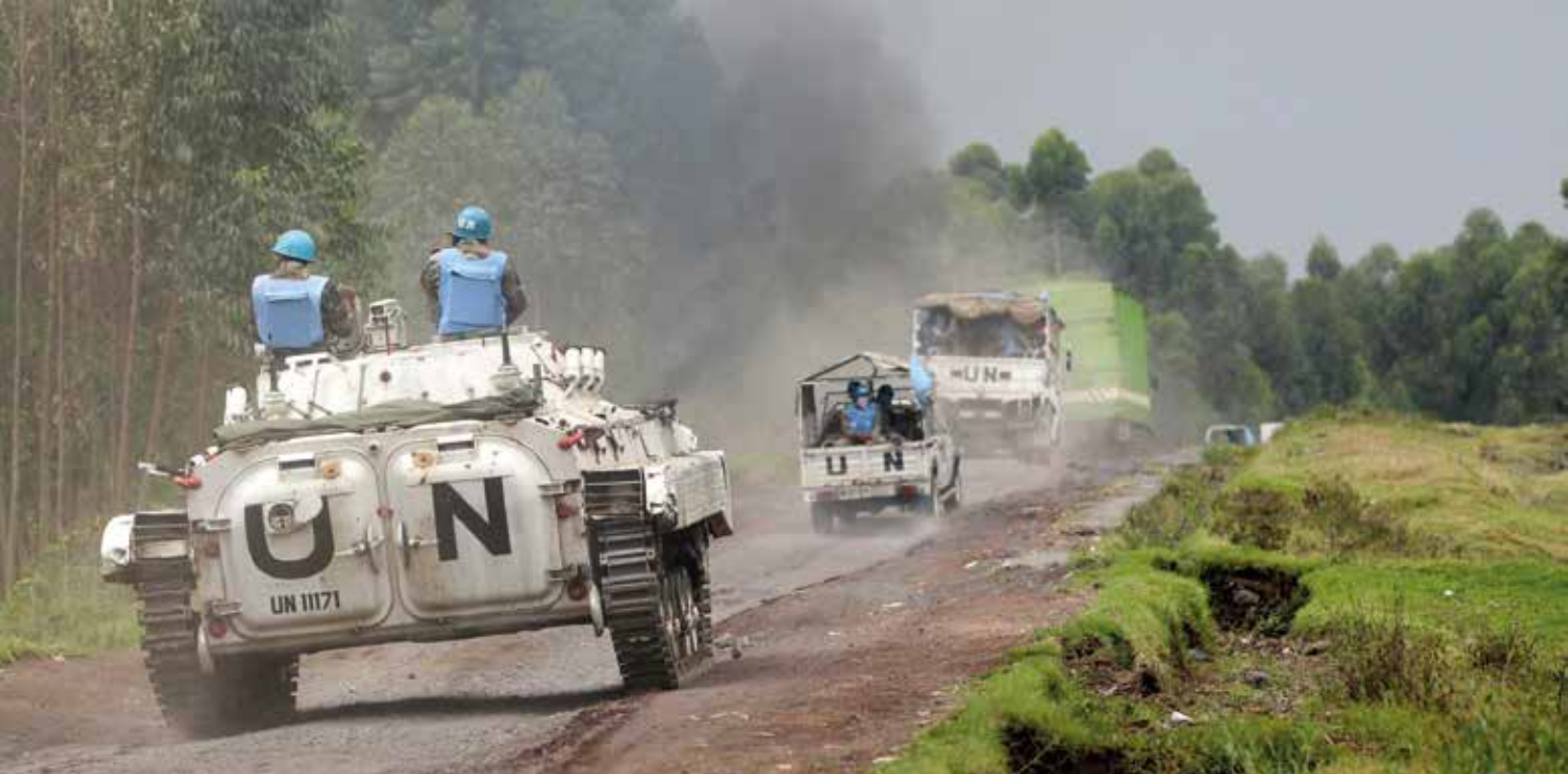
UNO-Friedenstruppen der MONUSCO in der Nähe von Goma im Osten der Demokratischen Republik Kongo, 7. August 2013.