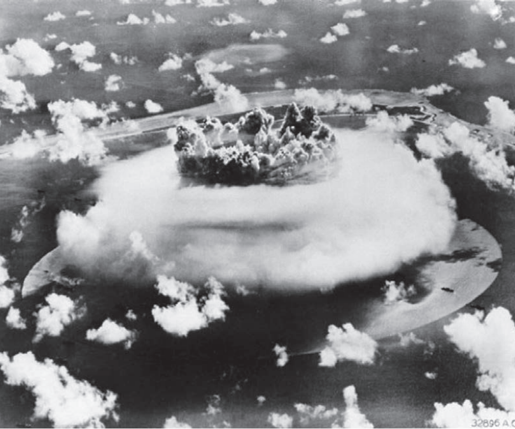
Ein Atomwaffentest auf dem Bikini-Atoll 1946.