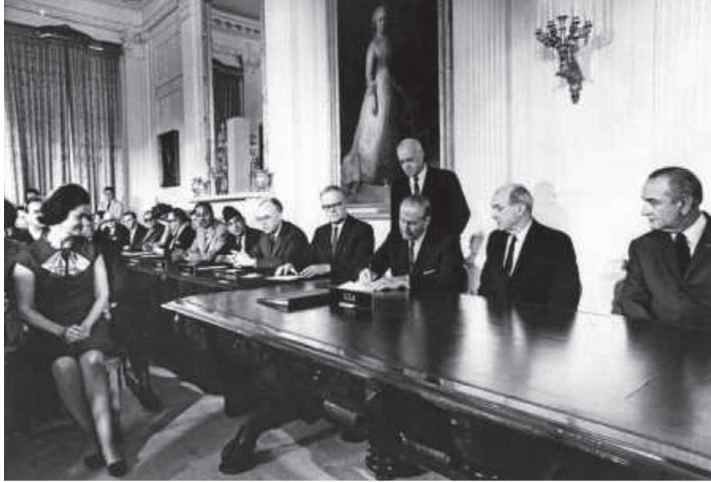
William Foster, Chefunterhändler der USA für den Atomsperrvertrag, unterzeichnet den Vertrag am 1. Juli 1968, während Präsident Lyndon Johnson und Lady Bird Johnson zuschauen. US-Aussenminister Dean Rusk sitzt neben dem Präsidenten, und eine Reihe von Botschaftern sitzt am äussersten Ende des Tisches, darunter der sowjetische Botschafter Anatoly Dobrynin (Fünfter von rechts).

Die Atomwaffenstaaten und praktisch alle Nato-Verbündeten hatten die Vertragsverhandlungen meist mit dem Argument boykottiert, ein Verbotsvertrag würde den Atomsperrvertrag untergraben. Dieser Vorwurf zieht aber nicht, da der Verbotsvertrag ausdrück-