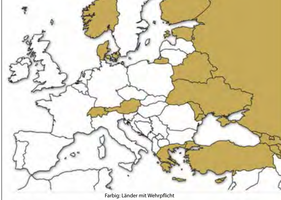
Farbig: Länder mit Wehrpflicht