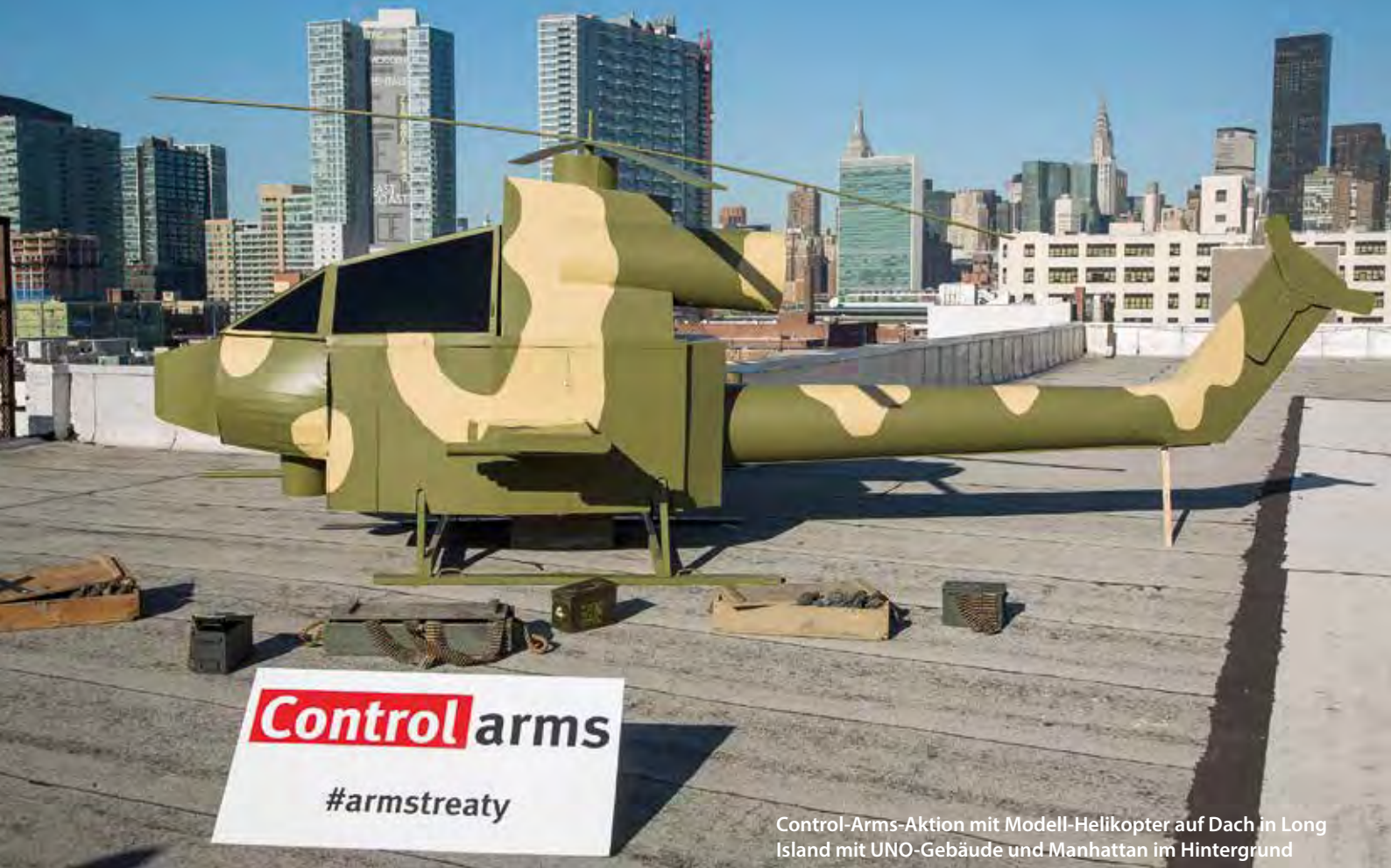
Control-Arms-Aktion mit Modell-Helikopter auf Dach in Long Island mit UNO-Gebäude und Manhattan im Hintergrund

Der UNO-Waffenhandelsvertrag ATT liegt zur Unterzeichnung auf