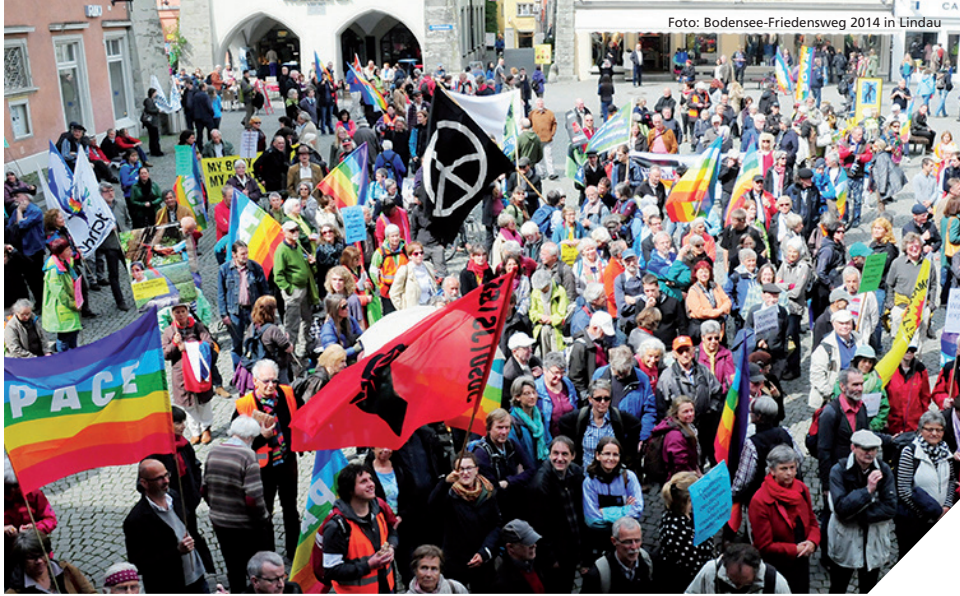
Foto: Bodensee-Friedensweg 2014 in Lindau